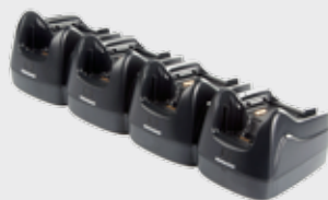
• 94A150037 Base a 4 postazioni • 94A150038 Base Ethernet a 4 postazioni