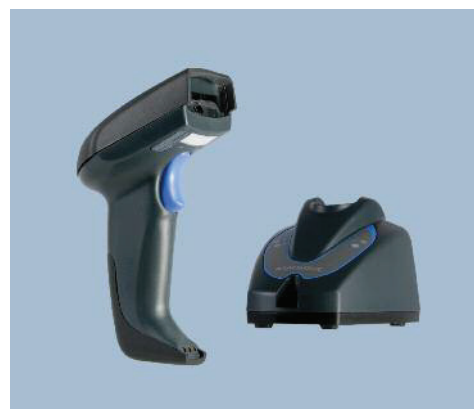
Lettore QuickScan Mobile e culla